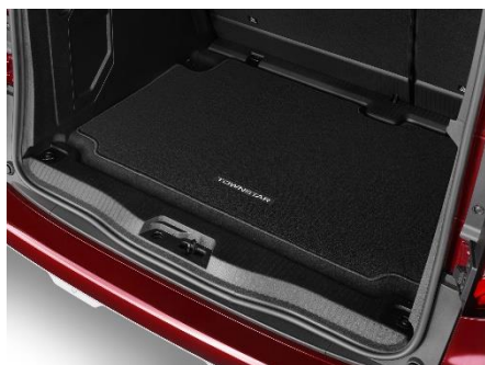
Mata bagażnika welurowa