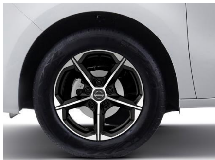
Felgi ze stopu metali lekkich 16"