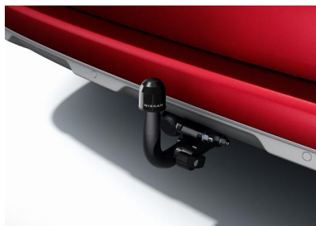
Hak holowniczy - zdejmowany