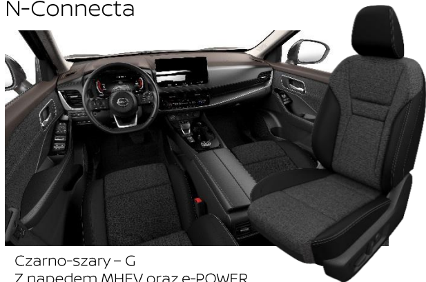
Czarno-szary – G Z napędem MHEV oraz e-POWER