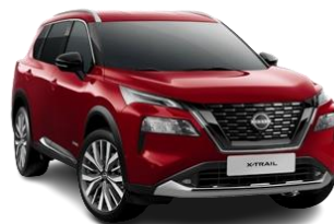
Czerwony - NBL