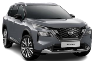
Ceramiczny szary - KBY