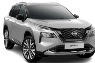
Srebrny - K23