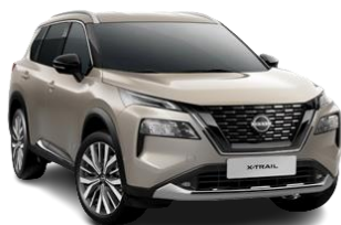
Szampański - KAY