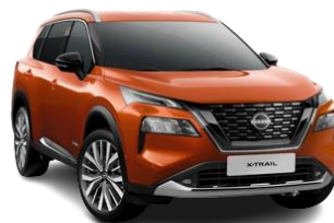
Pomarańczowy - EBL