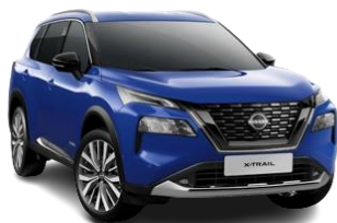
Niebieski - RBY