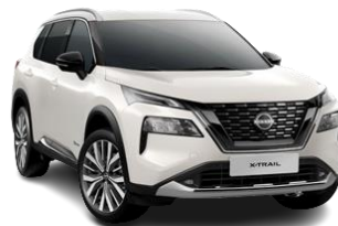
Biały perłowy - QAB