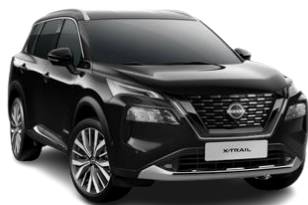
Czarny perłowy - G41