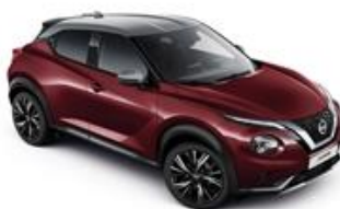
Burgundowy + Srebrny dach - XEE Personalizacja wnętrza N-Design: B