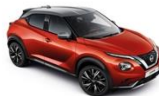
Czerwony Fuji Sunset + Srebrny dach - XEZ