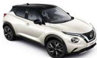
Biały perłowy + Czarny dach - XDF Personalizacja wnętrza N-Design: W, B

N-Design - Standard (kolor XEZ nie dostępny dla wersji wyposażenia N-Design)