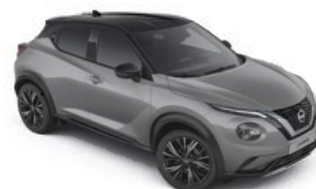
Szary ceramiczny + Czarny dach - XFU Personalizacja wnętrza N-Design: B

Dostępne 3 opcje personalizacji wnętrza dla wersji N-Design: