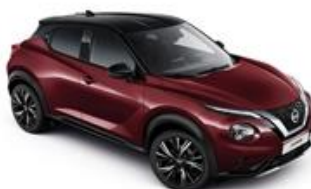
Burgundowy + Czarny dach - XDX Personalizacja wnętrza N-Design: B