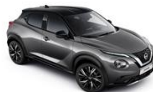
Szary + Czarny dach - XDJ Personalizacja wnętrza N-Design: W, B, R