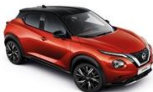
Czerwony Fuji Sunset + Czarny dach - XEY Personalizacja wnętrza N-Design: B