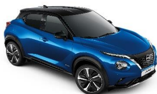
Niebieski + Czarny dach - XFV Personalizacja wnętrza N-Design: B