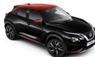
Czarny + Czerwony Fuji Sunset dach - XFC Personalizacja wnętrza N-Design: B, R