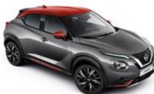
Szary + Czerwony Fuji Sunset dach - XFB Personalizacja wnętrza N-Design: B