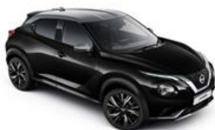
Czarny + Srebrny dach - XDZ Personalizacja wnętrza N-Design: B