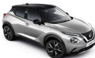
Srebrny + Czarny dach - XDR Personalizacja wnętrza N-Design: B